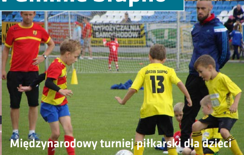
Międzynarodowy turniej piłkarski dla dzieci