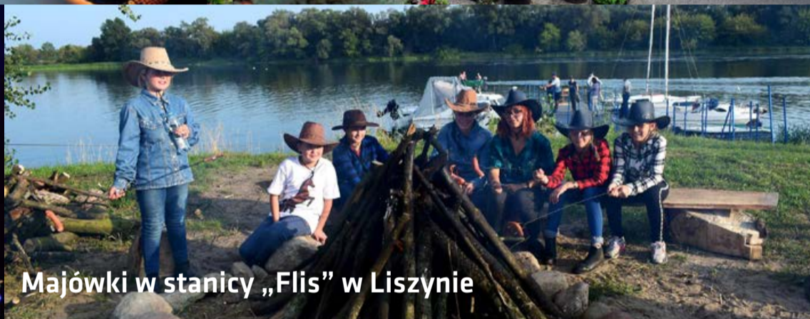
Majówki w stacji „Flis” w Liszynie