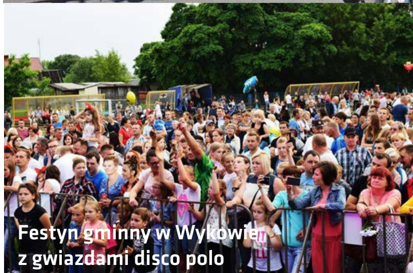
Festyn gminny w Wykowień z gwiazdami disco polo