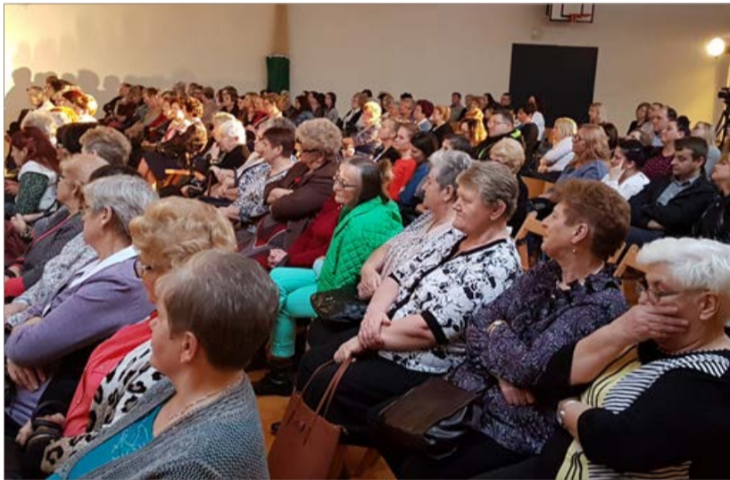
W Gminnym Dniu Kobiet wzięło udział ponad sto pań