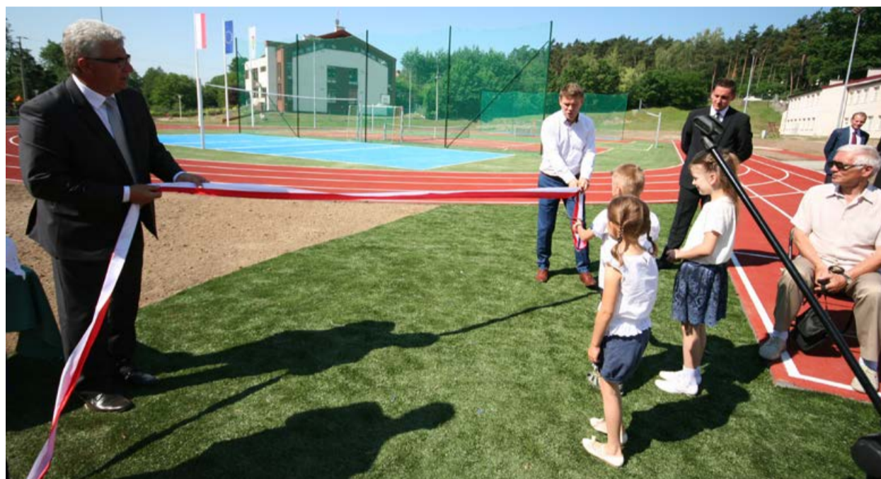
Oficjalne otwarcie „Orlika” lekkoatletycznego

politycznym w gminie. W samorządzie szybko rysuje się konflikt pomiędzy większością radnych, a nowym wójtem. Radni najbogatszej gminy w powiecie płockim uchwalają pensję wójta na minimalnym poziomie.