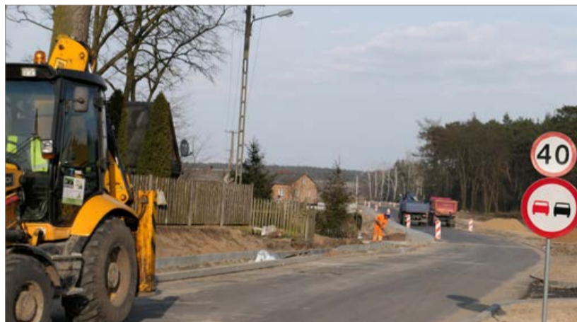
Budowa ulicy Pocztowej w Słupnie