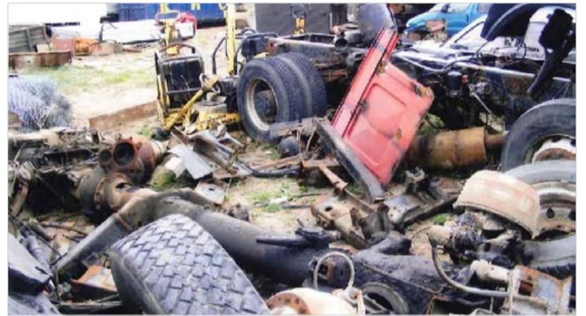
Tak było wcześniej