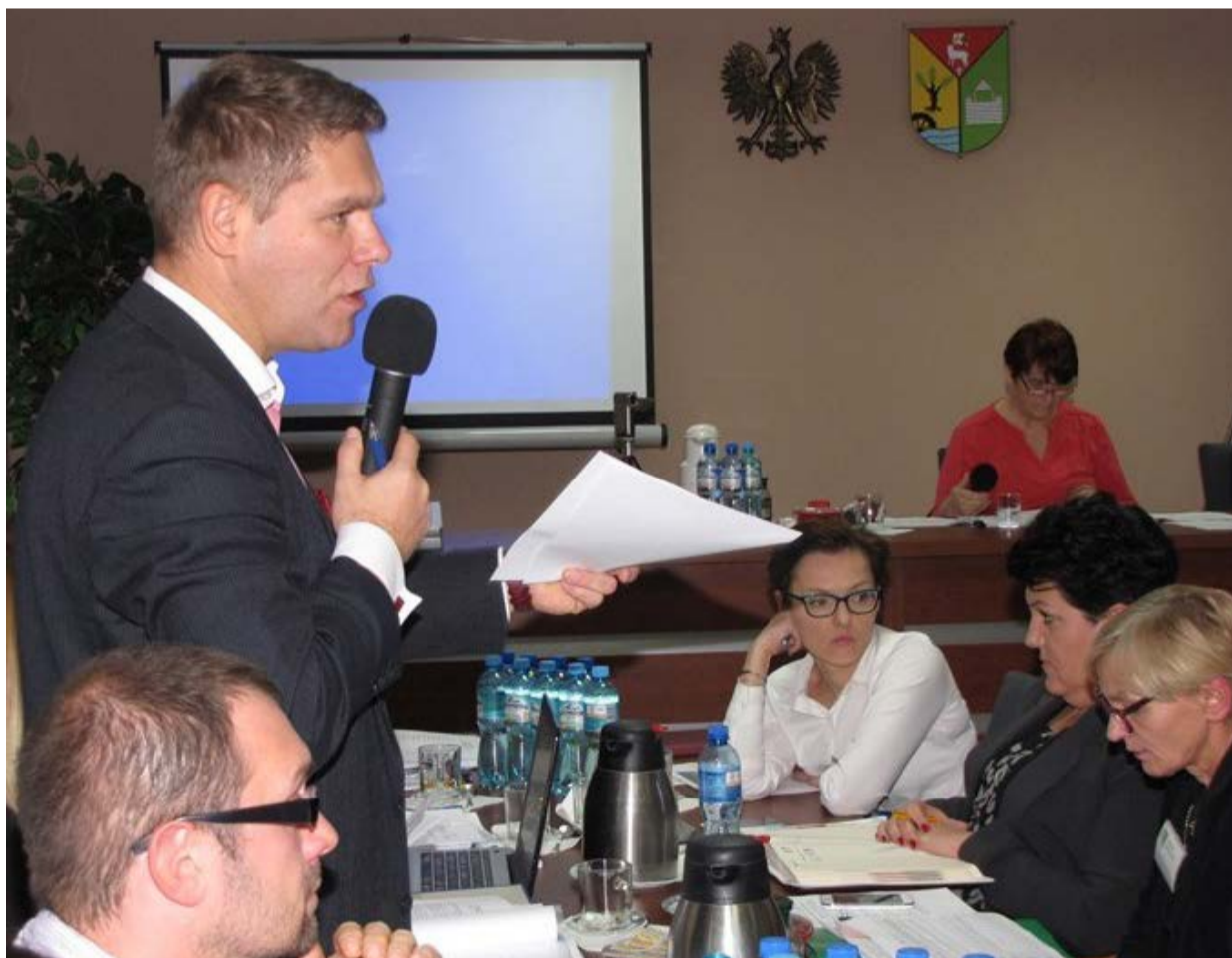
Sesje Rady Gminy były bardzo burzliwe i długotrwałe