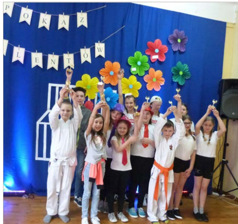
Wszystkie dzieci zostały nagrodzone