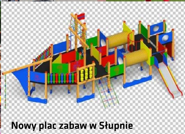
Nowy plac zabaw w Słupnie