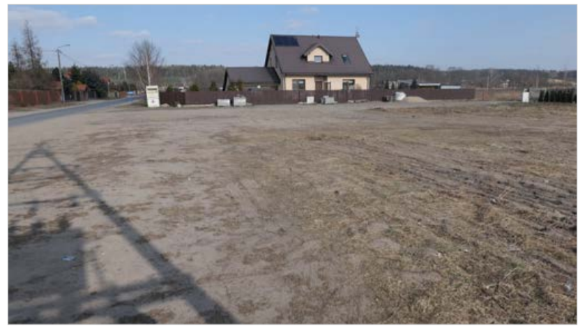
Tak jest teraz