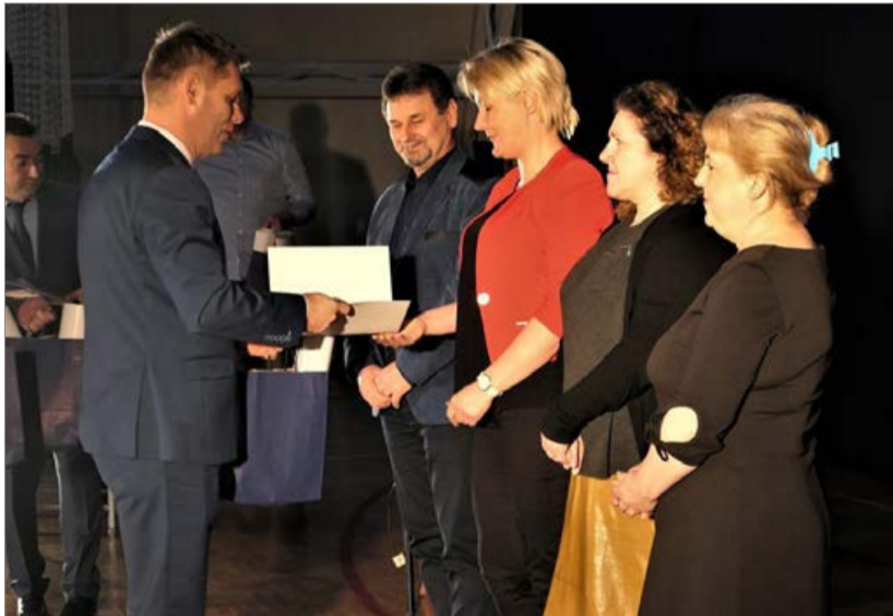
Wójt podziękował sołtysom