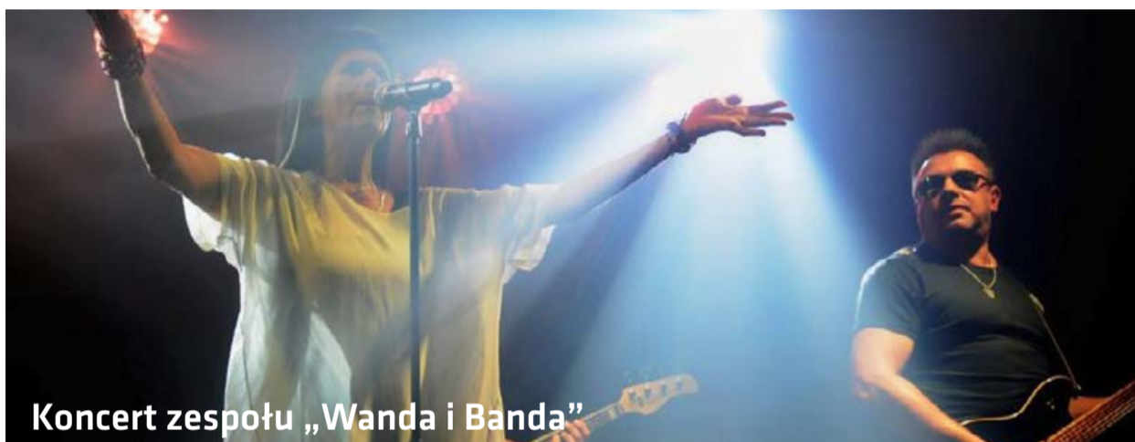
Koncert zespołu „Wanda i Banda”