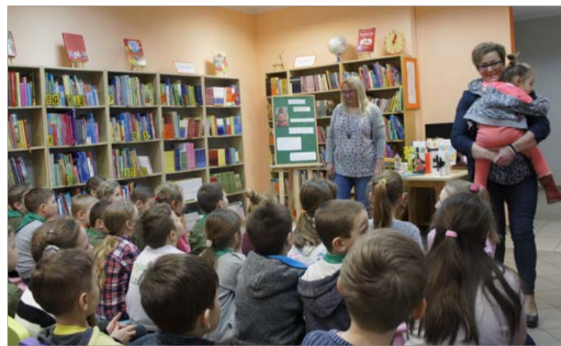
Dzieci z ciekawością słuchały autorki

o twórczości i języku polskim. Dzieci bardzo szybko nawiązały świetny kontakt z pisarką i aktywnie uczestniczyły w zabawach słowem, zadały również mnóstwo pytań, na które autorka udzielała wyczerpujących odpowiedzi. Dziękujemy wszystkim uczestnikom i autorce za sympatyczne, przebiegające w fantastycznej atmosferze, spotkanie. Zapraszamy na kolejne imprezy organizowane przez naszą placówkę. MK