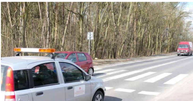
Wkrótce na przejściu będzie bezpieczniej