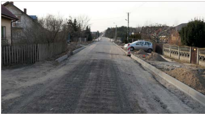
Budowa drogi Borowiczki-Pieńki - Bielino - Liszyno