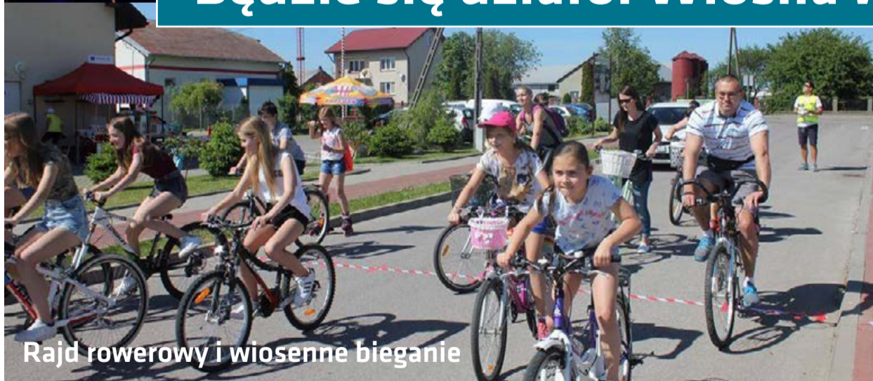
Rajd rowerowy i wiosenne bieganie