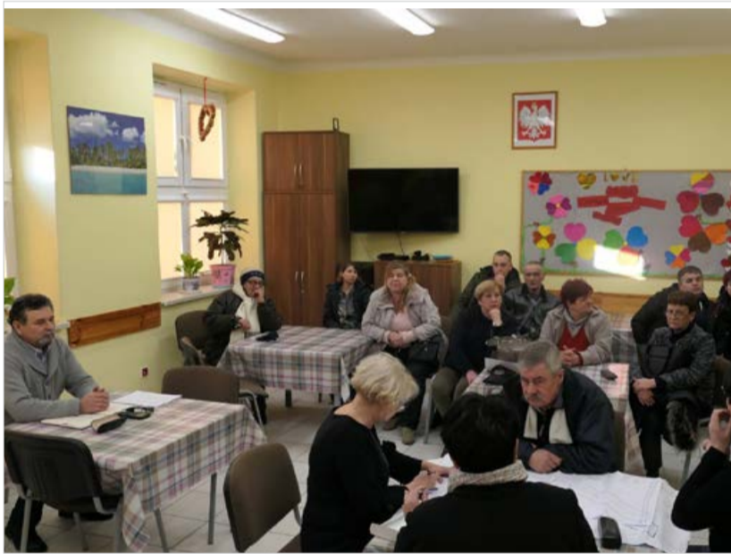
Zebranie z mieszkańcami Gulczewa