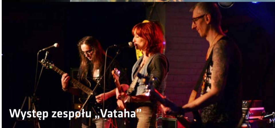
Występ zespołu „Vataha”