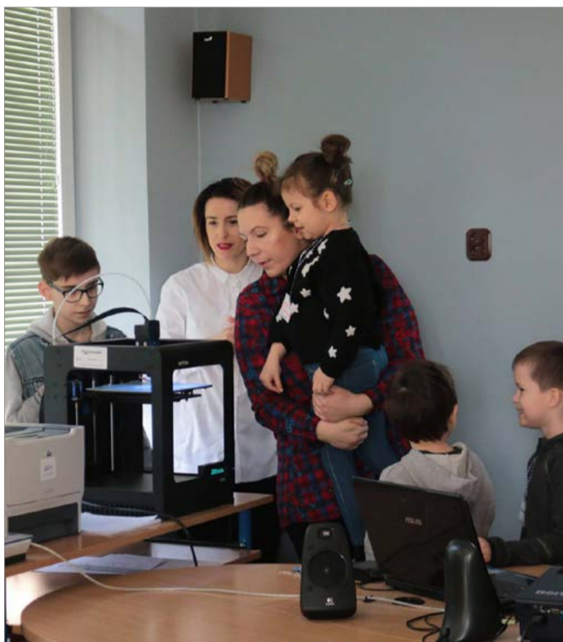
Duże zainteresowanie wzbudziła drukarka 3D