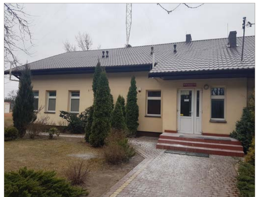
Remontowana świetlica w Wykowie