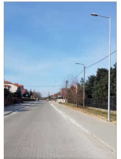
Oświetlenie na ulicy Bohuna w Nowym Gulczewie

Podpisanie umów dla wszystkich części nastąpi w pierwszym tygodniu kwietnia. Procedura w toku.