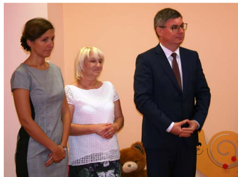
Na uroczyste otwarcie żłobka w Słupnie przybył ówczesny wiceminister administracji i cyfryzacji Jan Grabiec