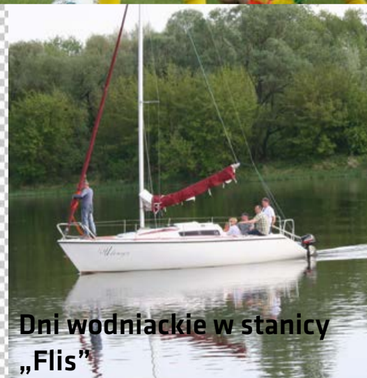
Dni wodniackie w stacji „Flis”